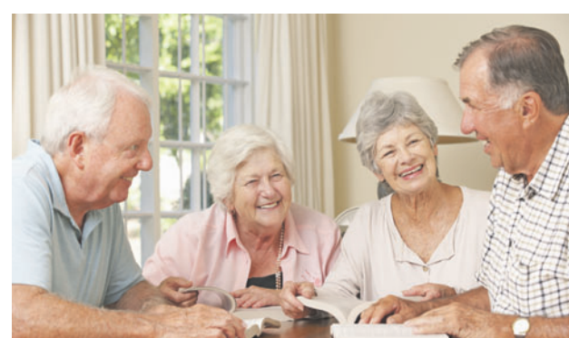
Nach langer Suche hat die Balzner Seniorenkommission nun einen Treffpunkt gefunden.

BALZERS Lange hat die Seniorenkommission Balzers nach einem passenden Treffpunkt für Senioren gesucht. Nun ist sie fündig geworden: In einer Liegenschaft an der Fürstenstrasse. Die Räumlichkeiten sollen auch Familien, Müttern mit Kindern und ähnlichen Gruppen dienen. Der Balzner Gemeinderat genehmigte für die Realisierung einen Nachtragskredit in der Höhe von 296 000 Franken. Das beschloss dieser an seiner Sitzung vom 1. April einstimmig.