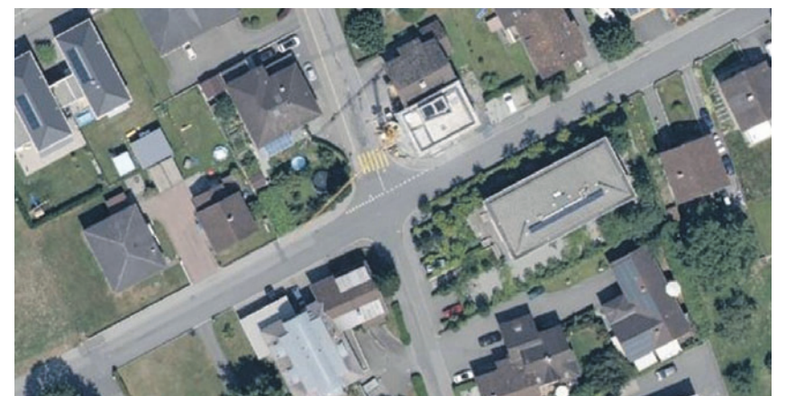
Seit 2017 gibt es an der Kreuzung keinen Zebrastreifen mehr.

Die Gemeinde sehe aufgrund aktueller Messungen zwar keinen dringenden Handlungsbedarf, berücksichtige allerdings, dass es sich bei der Strasse Iramali um einen Schulweg handelt. Laut dem Gemeinderatsprotokoll vom 1. April liess der Gemeinderat deshalb sieben Varianten mit Lösungsvorschlägen ausarbeiten. Für folgende habe sich der Gemeinderat entschieden: Die sogenannte Aufstellfläche, also der Be-