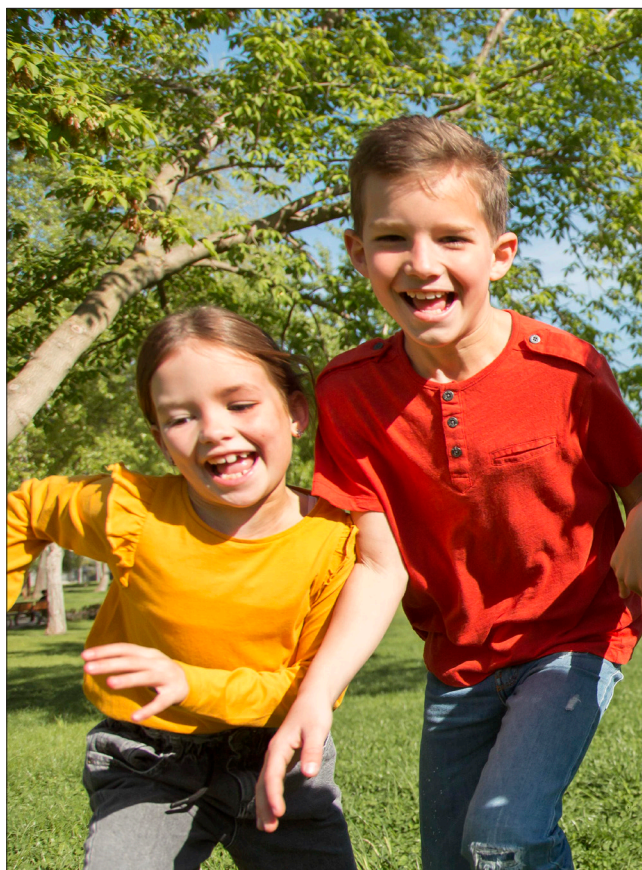
Immer in Bewegung. Die Schulen werden dank FlickFlack stärker f

Welchen Beitrag kann das Projekt FlickFlack hier zusätzlich leisten?