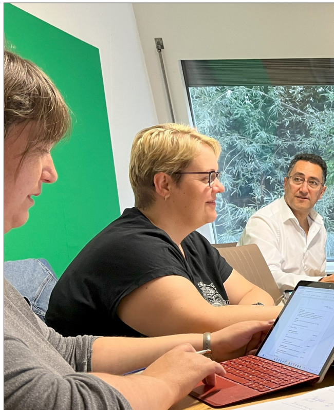
Engagiert. Der Elternverband ermutigt Eltern, bei schulischen Lösungen

H.M.: Wir schauen auf eine 30-jährige Vereinsgeschichte zurück. Das heisst, dass es bereits seit 30 Jahren Elternmitwirkung in Liechtenstein gibt. Elternmitwirkung lebt in allen 11 Gemeinden und ist etabliert. Gemeinsam Schulentwicklung zu gestalten, sich wertschätzend zu begegnen und die Grenzen zu akzeptieren sind Erfolgsfaktoren für eine erfolgreiche Zusammenarbeit.