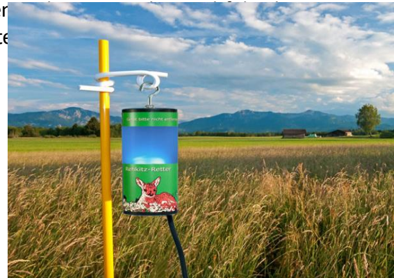
Effektive Rehkitz-Rettung dank modernster Elektronik