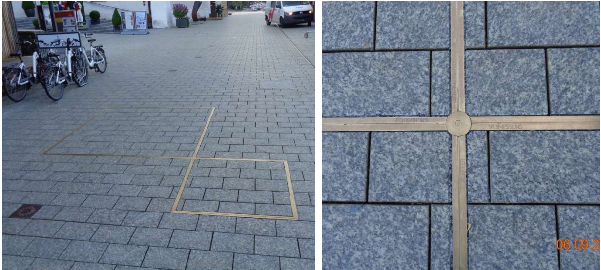
Abbildung 1 Klafterinstallation aus Messing