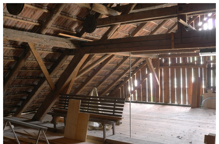
Abb. 6: Am Dachgebälk der Scheune Seilwinde und Seilrollen eines Fuderaufzugs, 2. Viertel 20. Jahrhundert.