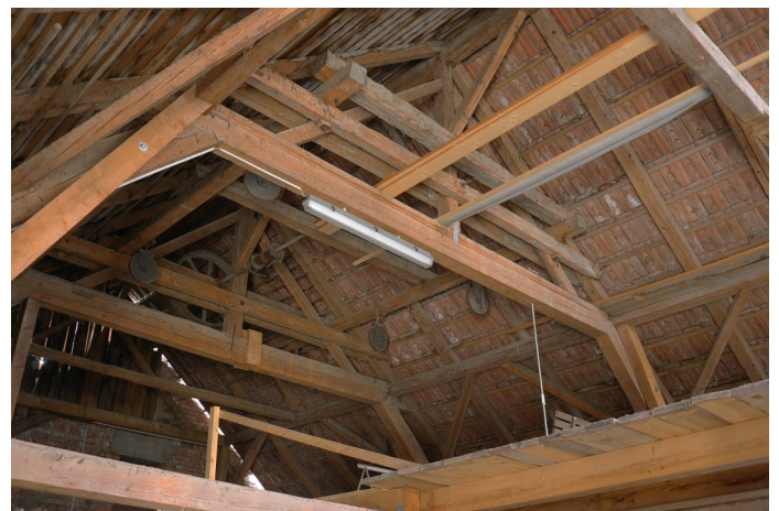
Abb. 5: Scheunendachstuhl von 1922.