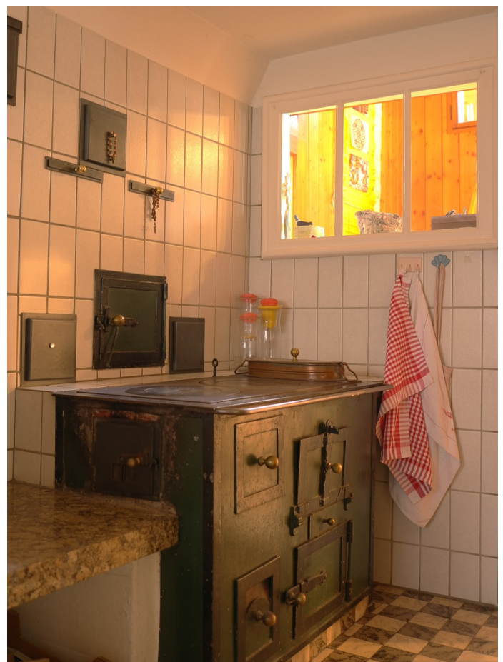
Abb. 3: Herdanlage des frühen 20. Jahrhunderts.