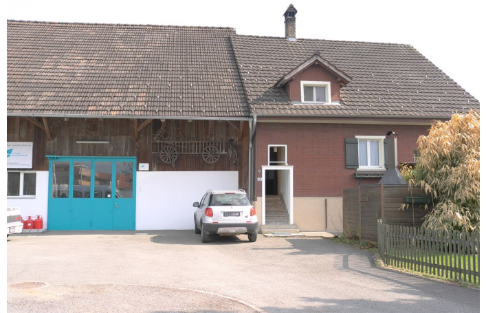
Abb. 4: Nordwestfassade mit der Stallscheune von 1922.

Die Doppelhofstätte 29/30 im Spidach datierte in die Baujahre 1782 und 1784. Die markante Doppelhofstatt Nr. 72/73 an der Dorfstrasse steht seit 1787. 1787 erstellte auch Fährmann Martin Büchel an der Giessenstrasse 19 ein Haus und 1789 Wendelin Öhri eines an der Oberweilerstrasse 13. Heiligkreuz 6 entstand 1794. Hofgasse 29 wurde 1671 vorerst an unbekanntem Ort erstellt und 1801 an seinen heutigen Standort versetzt. Das Zollhaus an der Giessenstrasse 4 ersetzte 1804 einen Vorgängerbau von 1685.