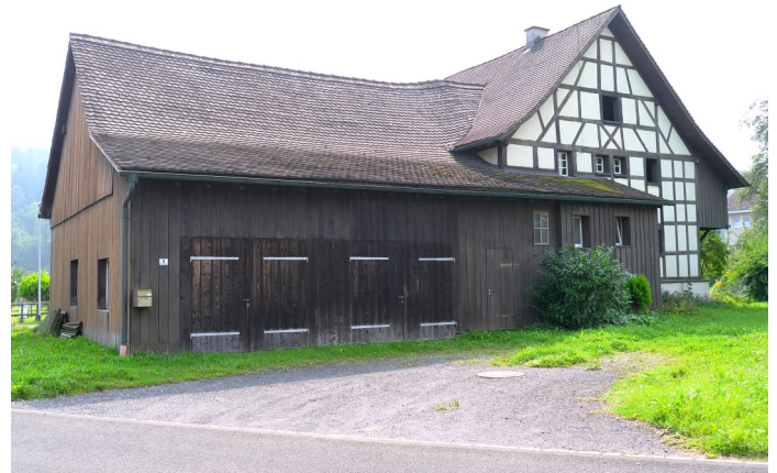
Abb. 2: Nordansicht mit der Wohnhaus-Nordwestfassade in Sichtfachwerk von 1782.

Die Stallscheune von 1808 stösst gegen das Wohnhaus. Da die Wohnhauswand keinerlei Spuren von Verwitterung aufweist, und ihrem Lehmbaubereich ein schützender Putz fehlt, kann man annehmen, dass hier bereits vor 1808 ein Anbau bestand. Auch die Stallscheune wurde in einer Mischbauweise aus verblatteten Bohlenständerwänden im Stallbereich und verbrettertem Fachwerk im Scheunenbereich errichtet. Manche Balken der Scheunen-Konstruktion sind zweitverwendet und verweisen auf spätere umfassende Umbauten oder Reparaturarbeiten.