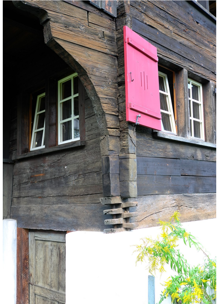
Abb. 4: Wohnhaus-Südecke in Blockbauweise von 1782 auf einem Schwellenkranz mit Mehrfach-Zungenschloss, darüber Kragbalken zur Laube.

1979 wurde das markante und gut erhaltene Wohnhaus unter Denkmalschutz gestellt. 1980–82 erfolgten umfassende innere und äussere Erneuerungen. Dabei wurden die neuzeitlichen Schindelschirme an den Blockbauwänden und die deckenden Putze an den Fachwerkfassaden wieder entfernt. Diverse Balken der Aussenwände wurden ausgewechselt und die Fenster geweitet und erneuert. Auch der Ökonomiebau wurde 1980-82 umfangreichen baulichen Eingriffen unterzogen. Die Ställe sind seither ausgeräumt und durch Garagen ersetzt. Eine erneute Instandsetzung, samt Ausbau der ehemaligen Ökonomie, ist geplant.