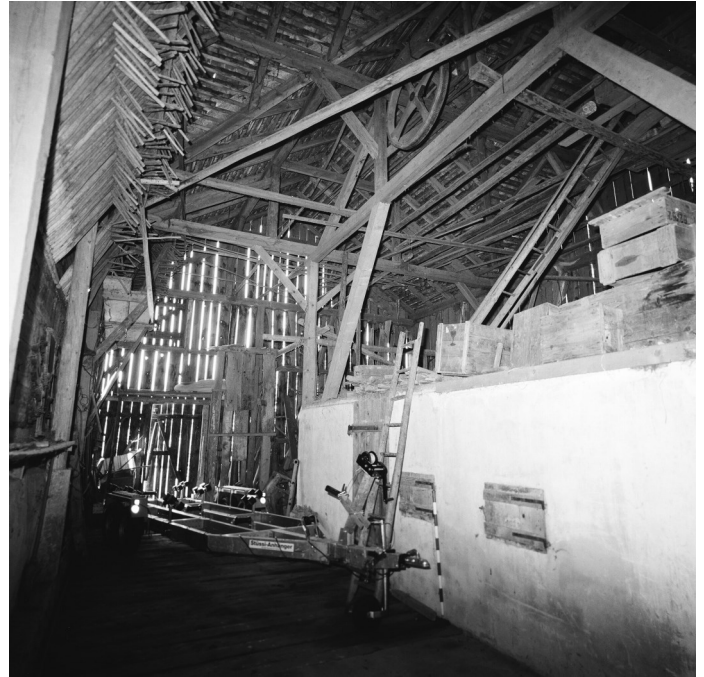
Abb. 2: Einsicht in die Stallscheune von 1940.

Mit der baugeschichtlichen Untersuchung und Dokumentation alter Bauten sind mittlerweile einige versetzte Wohnhäuser bekannt. Der Anlass zur Translozierung hat unterschiedliche Ursachen. Einerseits gehörten nach mittelalterlichem Lehenrecht die Bauten von Schublehen Pachtverhältnissen als Fahrhabe den Lehennehmern.