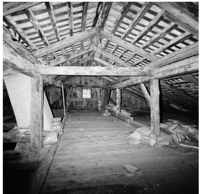
Abb. 7: Dachstuhl von 1780.