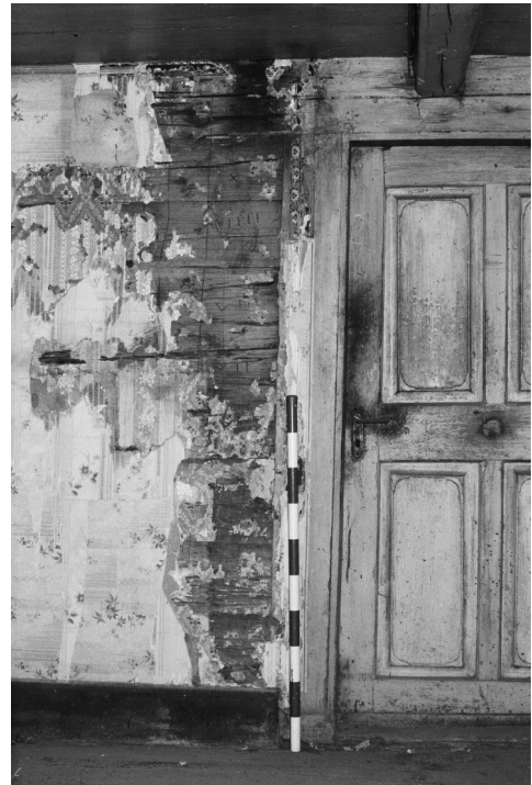
Abb. 5: Stube, zur sachgerechten Translozierung des Gebäudes sind die Wandbalken nummeriert.