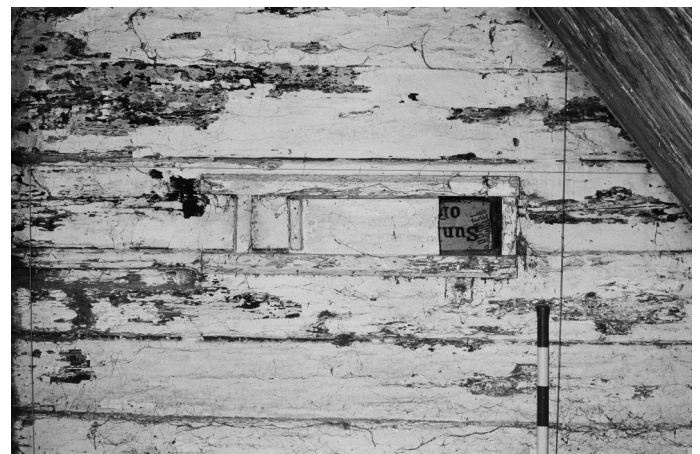
Abb. 4: In der Küche Lüftungsöffnung mit Schliesssschieber.