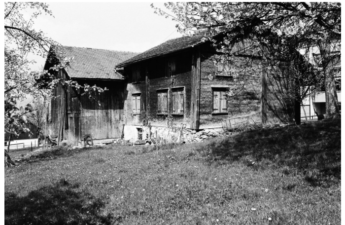
Abb. 3: Eschen, Nendeln, Oberstädtle 46. Südansicht.