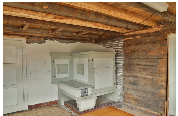
Abb. 5: In der Stube Bongerten 4 sandsteinerner Ofen in geschmiedetem Eisenrahmen, mit der Jahrzahl „1900“.