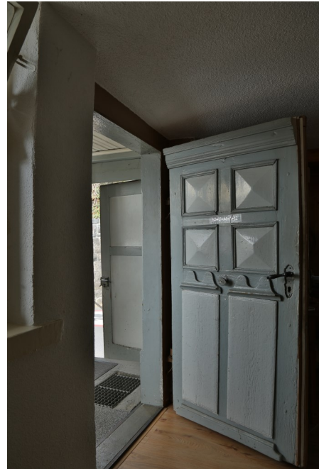
Abb. 7: Dekoratives Haustürblatt zu Bongerten 4.