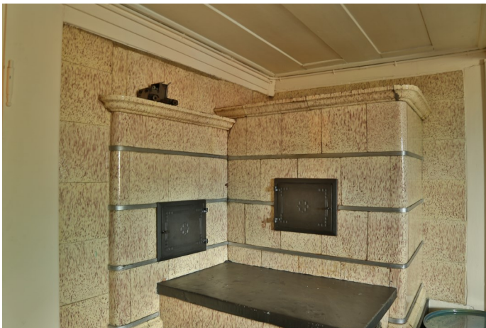
Abb. 8: In der Stube Bongerten 6 Kachelofen und Kaust vom Typ „Schädler Nendeln“, um 1900.