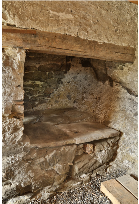
Abb. 4: Im Keller Bongerten 4 eingebaute Esse als Arbeitsplatz von Küfern.

Die Ökonomiebauten erscheinen als wesentliche Teile des bäuerlichen Hofstätten-Ensembles. Bereits 1810 ist zu jedem Hausteil ein Stall verzeichnet. Und einzelne erhaltene Balken weisen mit ihren Blattsassen wohl in eine Entstehungszeit im 18. Jahrhundert. 1888 wurden beide Stallscheunen durch Neubauten ersetzt (Abb. 9) und später je durch einen talseitigen Quergiebel-Anbau erweitert, zu Bongerten 6 1925 (Abb. 10), zu Bongerten 4 1946 (Abb. 11). Seit 1985 befinden sich in der Scheune zu Bongerten 6 Wohnungen und Nebenräume.