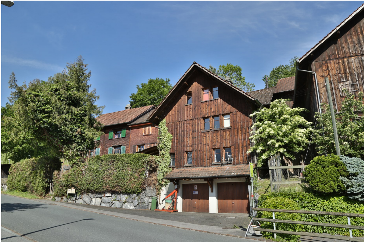
Abb. 10: Scheune zu Bongerten 6, erbaut 1888, 1925 mit Quergiebelanbau erweitert und 1985 zu Wohnungen ausgebaut, Ostansicht.