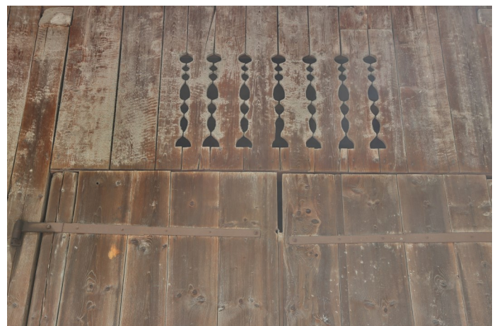
Abb. 9: Scheune zu Bongerten 4, dekorative Lüftungsöffnungen über dem Tenntor, 1888.