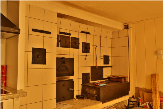
Abb. 6: In der Küche Bongerten 6 eiserner Holzherd.