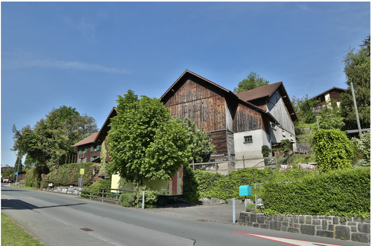
Abb. 11: Scheune zu Bongerten 4, erbaut 1888 und 1946 mit Quergiebelanbau erweitert, Ostansicht.