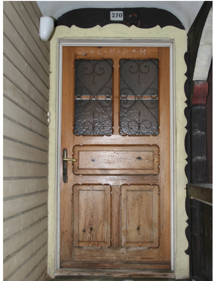
Abb. 4: Charakteristisch gestemnte und facettierte Haustür.