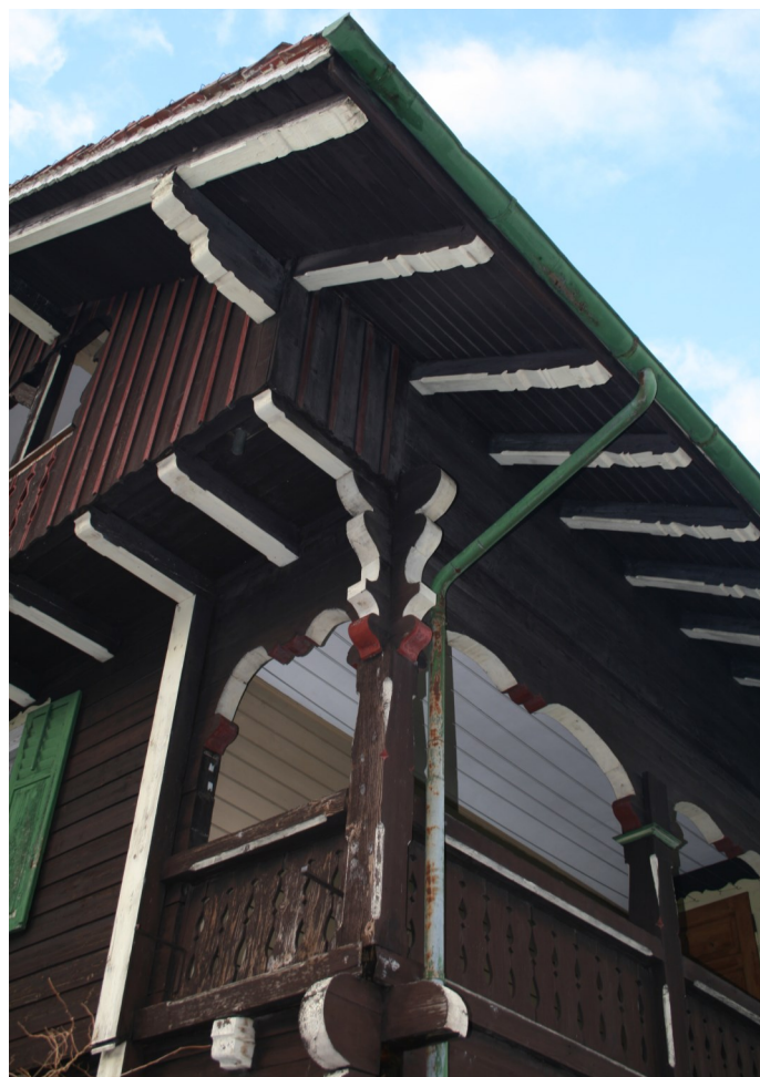
Abb. 3: Gestaltungsdetails an der Gebäude-Ostecke.