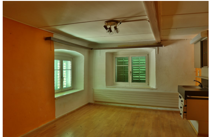
Abb. 4: Weite stichbogige Fensternischen im Wohnhaus Winkel 8 entsprechen barockzeitlicher Baumanier des 17. und 18. Jahrhunderts.