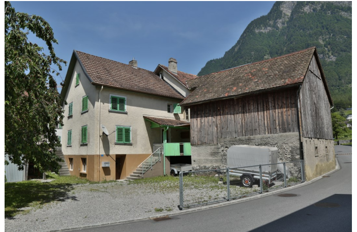
Abb. 2: Balzers 8, Winkel 8, Wohnhaus des Frühmessers. Südwestansicht.

Vorab in den Kellergeschossen lassen Unebenheiten der Wandoberflächen auf Mauerwerk eines spätmittelalterlichen oder frühneuzeitlichen Kernbaus deuten. Weite, stichbogige Fensternischen in Winkel 8 entsprechen barocker Baumanier des 17. und 18. Jahrhunderts. Der Dorfbrand vom Oktober 1795 traf auch die Bauten im Kirchhof. Winkel 6 wurde 1796, Winkel 8 1802 wieder hergerichtet. Die dendrochronologisch beprobten Konstruktionsbalken aus den Kellergeschossen und den Dachstühlen belegen, dass die beiden Wohnhäuser weitestgehend ausgebrannt waren.