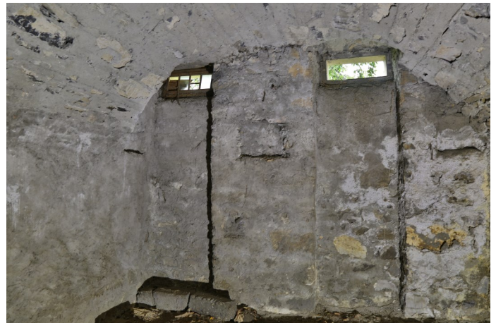
Abb. 2: Geräumiger Gewölbekeller, wohl als Weinlager.

Die Stallscheune erscheint in charakteristischer, im rätoromanischen Siedlungsraum beliebter Pfeilerarchitektur. Durch angepasste Nutzung des Gebäudes in Hanglage kommen die Stallräume in eine Art Untergeschoss zu liegen. Der ebenerdig aufgebaute Heuraum wird dadurch geräumiger und die Abladearbeiten erleichtert. (Abb. 4). Die Westfassade von 1853 weist zwei rundbogige Lüftungsöffnungen auf, ursprünglich mit Schirmbrettern geschlossen und original hausbauzeitlichem Kalkglattputz (Abb. 5).