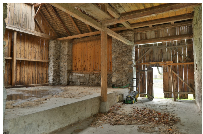
Abb. 4: Durch angepasste Ausnutzung der Hanglage liegt der Heuraum ebenerdig, wird dadurch geräumiger und erleichtert die Abladearbeiten.